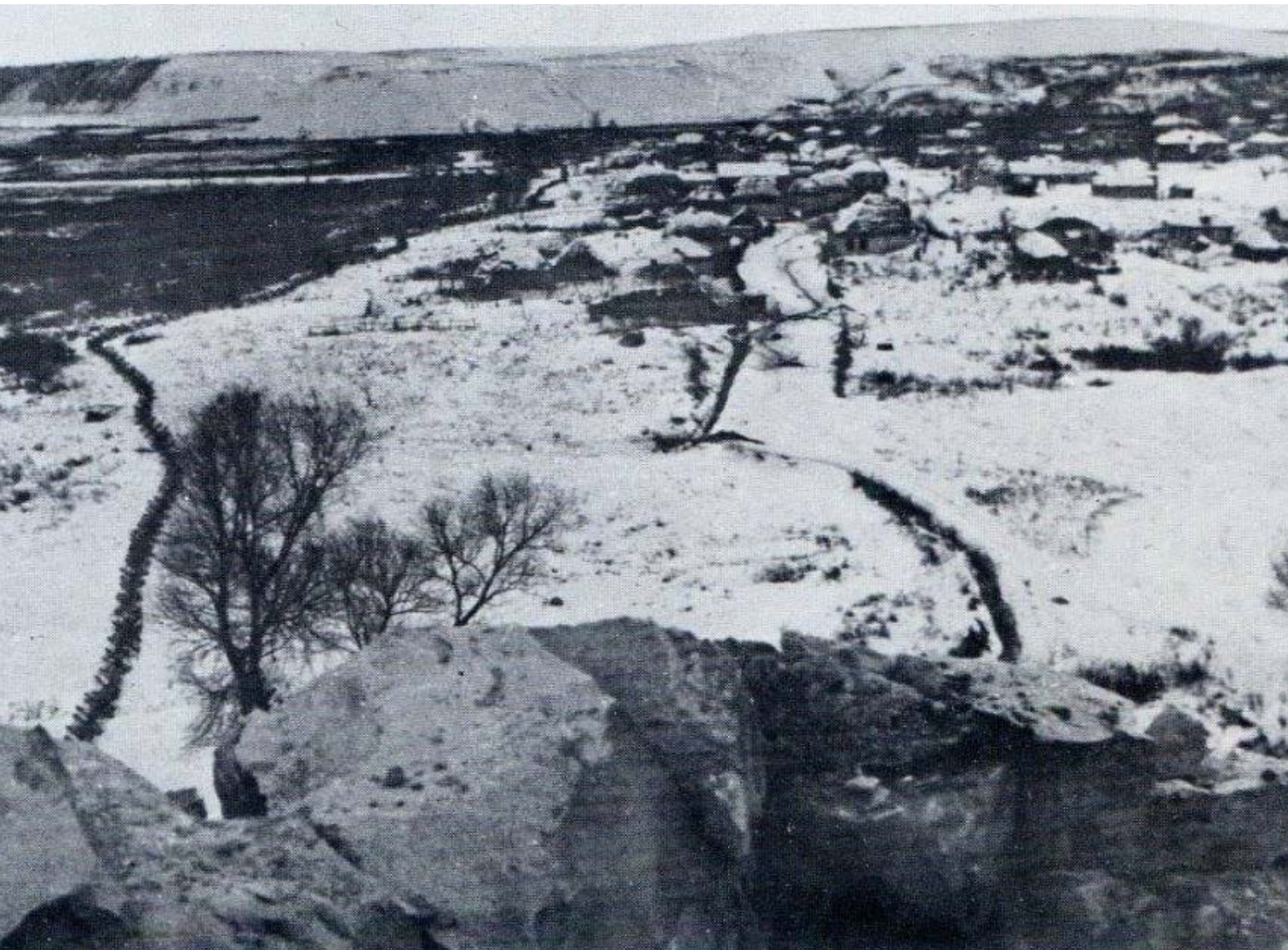
Dicembre 1942. Il villaggio di Belogore visto dal caposaldo Madonna: i reticolati lungo la riva destra del Don e, a tergo la prima linea, il fosso anticarro

“ La Regione Piemonte durante la seconda guerra mondiale ha pagato un prezzo altissimo di vittime. Solo nella Campagna di Russia i piemontesi che non sono tornati a casa sono stati 10312 ” :