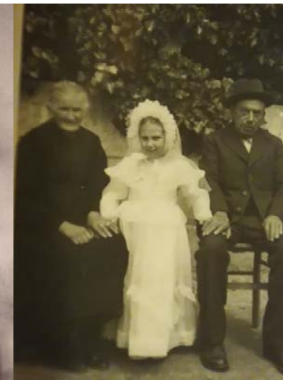
Aurora coi nonni